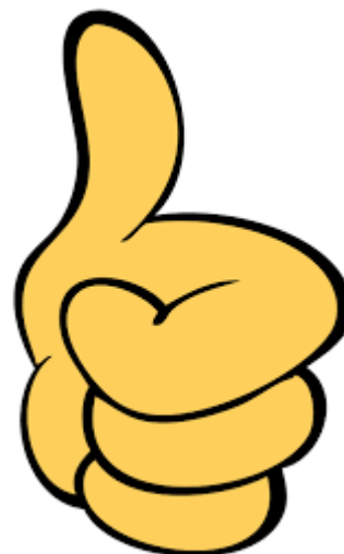
Taxa de conclusão de ciclo