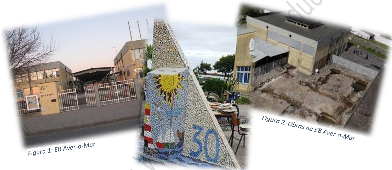
Figura 1: EB Aver-o-Mar

Se continuarmos viagem, enveredando por uma estrada mais interna com aproximação ao mar, e deixando para trás um casario que se esconde numa curva mais estreita, deparamo-nos com um edifício que se ergue ali num espaço mais amplo. É um edifício velho, gasto pelo peso da idade, um edifício em reestruturação... é a escola sede do Agrupamento de Escolas de Aver-o-Mar .